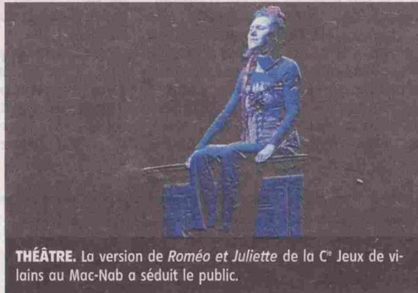
THÉÂTRE. La version de Roméo et Juliette de la C ie Jeux de vilains au Mac-Nab a séduit le public.

Sur la scène, plongée dans un noir quasi complet, avec en fond sonore la scie musicale, le saxophone et la guitare flamenco, les comédiens étaient pleins d'énergie et ne manquaient pas