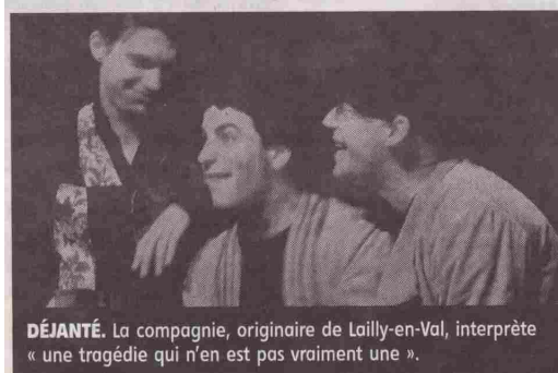
DÉJANTÉ. La compagnie, originaire de Lailly-en-Val, interprète « une tragédie qui n'en est pas vraiment une ».

Un « Roméo et Juliette » à la sauce Jim Carrey. La troupe de théâtre « Jeux de vilains » s'est éclatée, vendredi et samedi, sur la scène de l'espace Boutrouche, à Ingré, en se réappropriant la pièce de Shakespeare, pour une version décalée et contemporaine. Scie musicale, saxo, guitare flamenco,