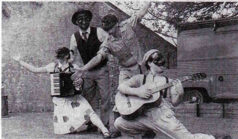
Le quatuor de la compagnie Jeux de Vilains dans ses œuvres.

« Qu'est-ce que tu fais là ? Non mais, prendre les gens par-derrière, ce n'est pas un spectacle de fesses ! » Embusqué derrière un arbre pour trouver de beaux angles, notre photographe vient de se faire débusquer. Et se fera reprendre derrière le camion ! Vif succès, qui prouve que les comédiens jouent réellement avec le public. « Le Cid ? Non, on n'a pas ! »